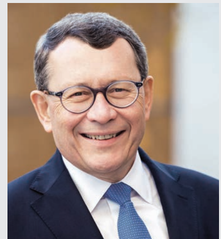
Autor: Wolfgang Greilich Notar seit 1989

Zum Hintergrund: Ein handschriftliches Ehegattentestament ist an strenge Formvorschriften gebunden, damit es wirksam ist. Nur Verheiratete und Verpartnerte haben überhaupt die Möglichkeit, ein solches gemeinsames Testament zu